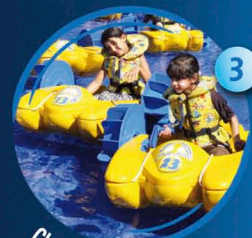
Club Piou-Piou 3 - 8 ans