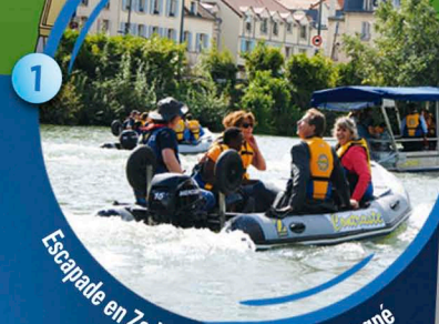
Escapade en Zodiac & Pilotage accompagné